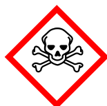
GHS06 Totenkopf mit gekreuzten Knochen